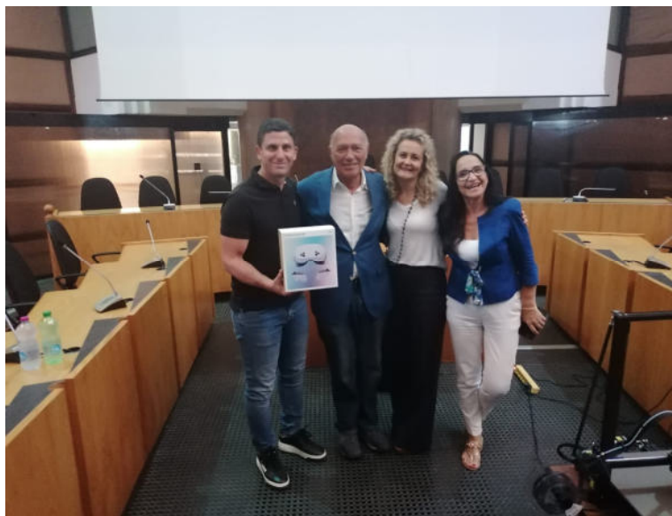
Sindaci di Cerveteri e Ladispoli