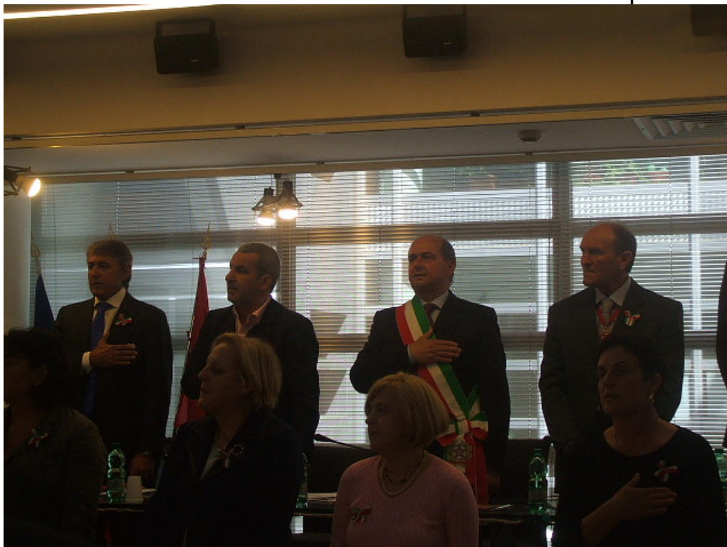
Convegno di avvio progetto Ge.Pac – Fiumicino – 5 maggio 2011

Esso si propone di focalizzare l'approccio dei giovani studenti europei delle Scuole Superiori di Malta, Romania, Grecia e Italia al Patrimonio Culturale del proprio territorio, coinvolgendo le Istituzioni Locali, le Soprintendenze ai Beni Archeologici e le Università nella conoscenza e nella valorizzazione del patrimonio.