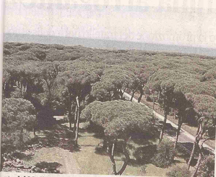
Costa del Mediterraneo

► Scoperto che alcuni alberi raggiungono un'età di 225 anni Gli agronomi: «una situazione eccezionale, senza precedenti»