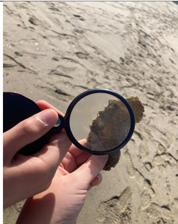
Riconoscimento di tracce animali