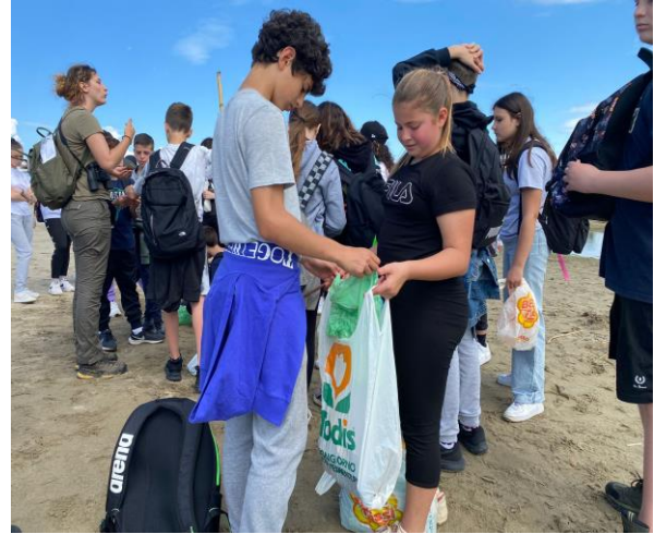
Pulizia della spiaggia.