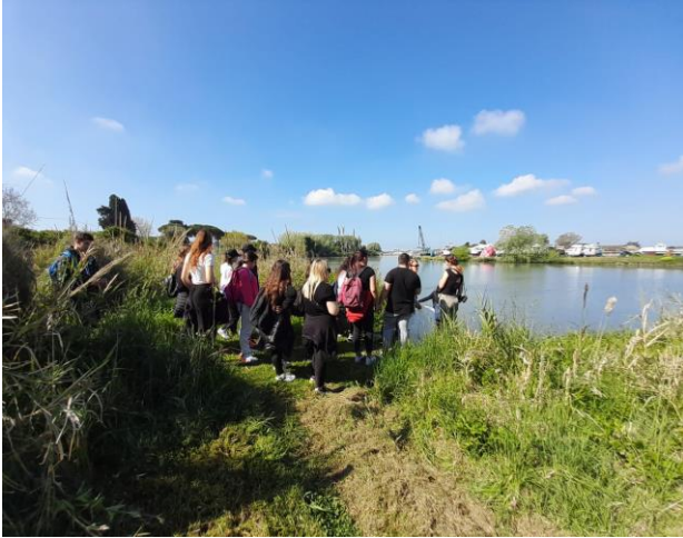
Studio delle acque di fiume e rilevamento del pH con cartine tornasole